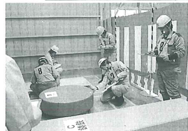
(写真は技能競技全国大会風景)