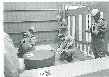
(写真は 技能競技全国大会風景)

平成24年度 JIS Z 3410 (ISO 14731)/WES 8103 による