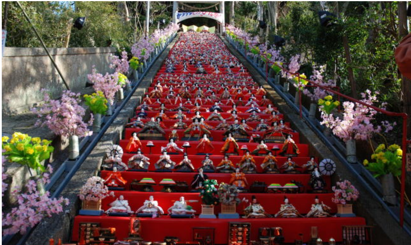
かつうらビッグひな祭り (千葉県勝浦市)

一般社団法人 東京都溶接協会 公益社団法人 ボイラ・クレーン安全協会 株式会社 三浦事務所 発行所・東京都江東区大島三丁目1番11号 産学協同センター 電話 03-3685-5700 (代表) 編集発行人 三浦 繁夫 © 2012 毎月1回1日発行 定価 100円・千共