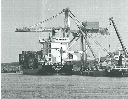
主催：公益社団法人 ボイラ・クレーン安全協会 / 後援：厚生労働省