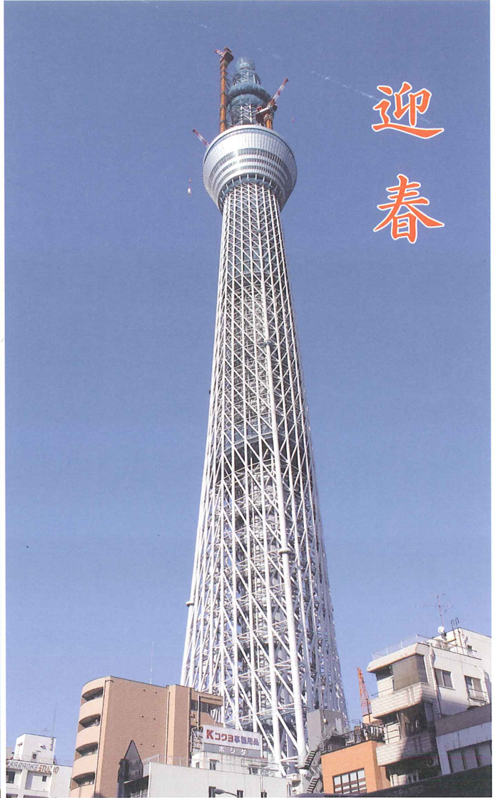
(カラー版は http://www.miura21.co.jp でご覧いただけます)