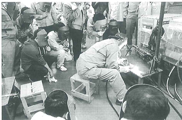
講師のTIG溶接を見学(10月27日、日本溶接技術センター)