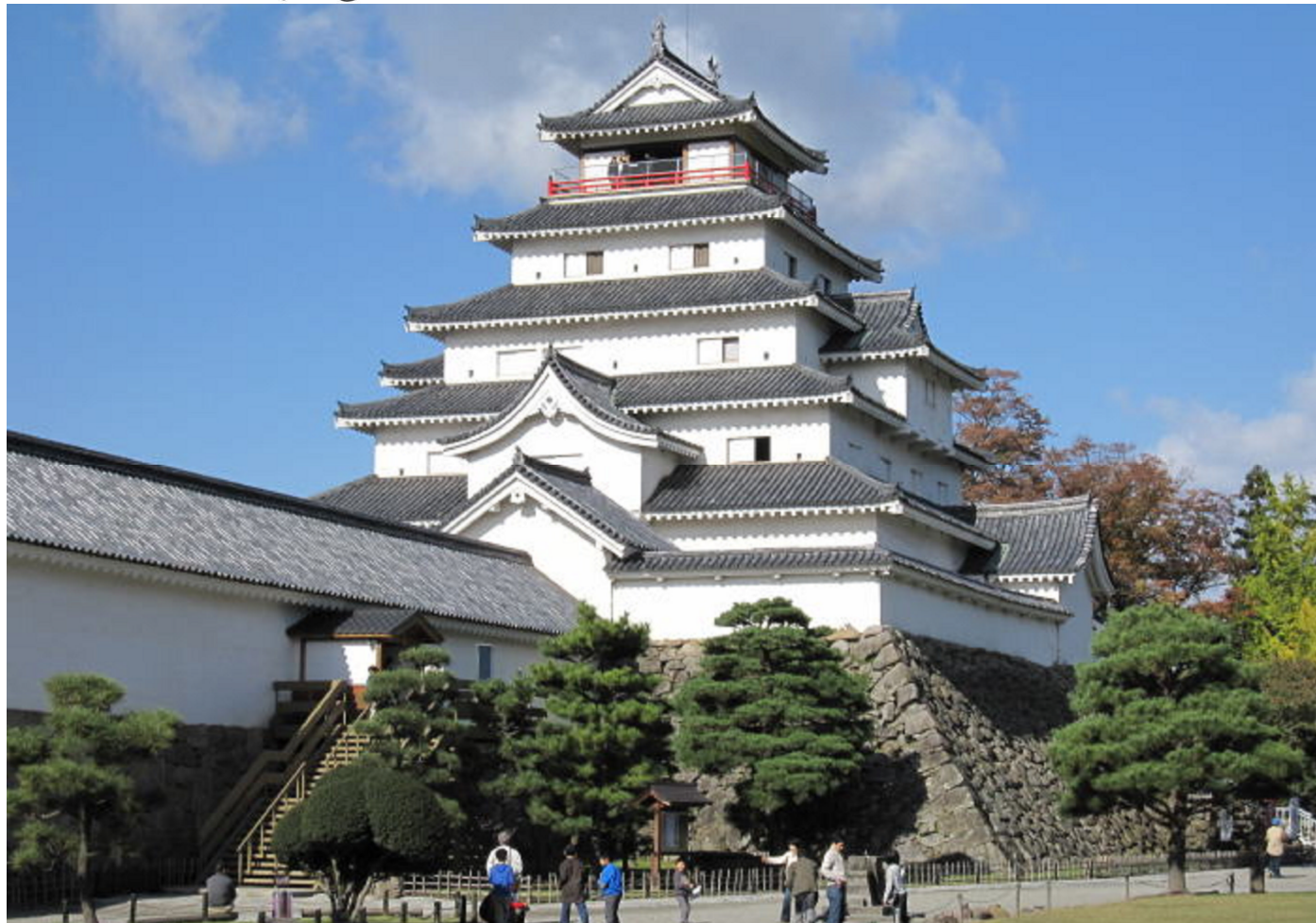
～若松城(鶴ヶ城)～ 福島県会津若松市

一般社団法人 東京都溶接協会 社団法人 ボイラ・クレーン安全協会 株式会社 三浦事務所 発行所・東京都江東区大島三丁目1番11号 産学協同センター 電話 03-3685-5700 (代表) 編集発行人 三浦 繁夫 © 2011 毎月1回1日発行 定価 100円・〒共