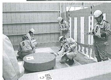
(写真は 第41回全国大会風景)

平成23年度 JIS Z 3410 (ISO 14731)/WES 8103 による