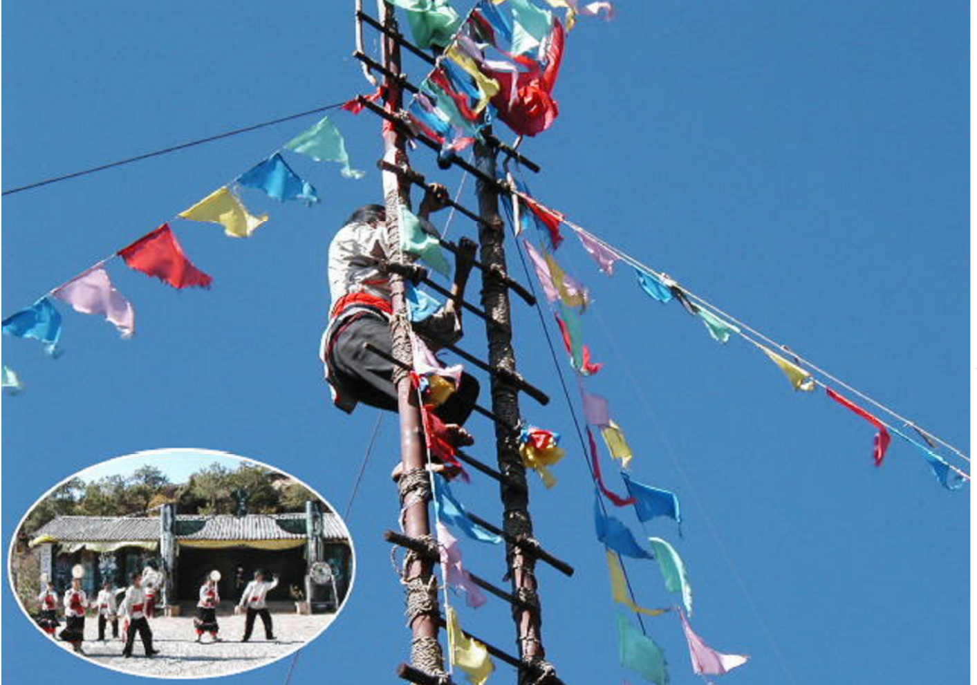
魔除けと祈りの旗「ルンタ」(別名タルチョー)

一般社団法人 東京都溶接協会 社団法人 ボイラ・クレーン安全協会 株式会社 三浦事務所 発行所・東京都江東区大島三丁目1番11号 産学協同センター 電話 03-3685-5700 (代表) 編集発行人 三浦繁夫 © 2011 毎月1回1日発行 定価 100円・〒共