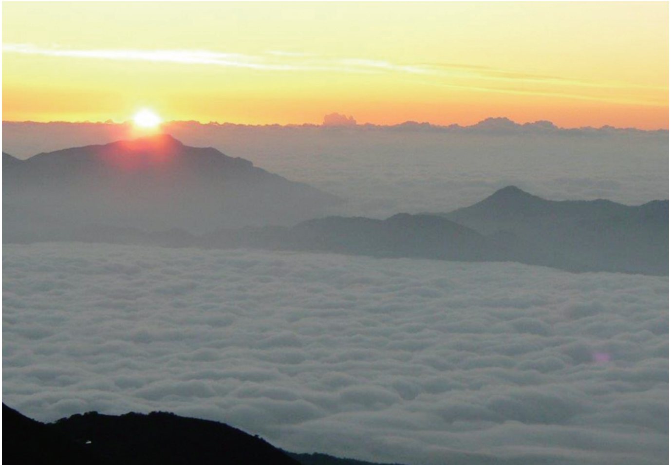
御来光(後立山連峰 白馬岳にて)

一般社団法人 東京都溶接協会 公益社団法人 ボイラ・クレーン安全協会 株式会社 三浦事務所 発行所・東京都江東区大島三丁目1番11号 産学協同センター 電話 03-3685-5700 (代表) 編集発行人 三浦繁夫 © 2022 毎月1回1日発行 定価100円・〒共