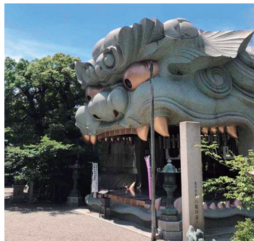
難波八坂神社 獅子殿 (大阪市浪速区)