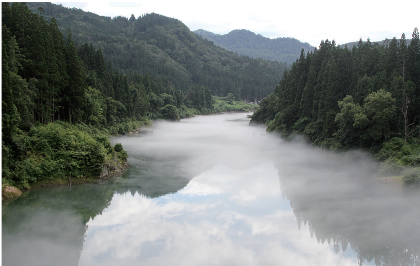
只見川 (ただみがわ)

一般社団法人 東京都溶接協会 公益社団法人 ボイラ・クレーン安全協会 株式会社 三浦事務所 発行所・東京都江東区大島三丁目1番11号 産学協同センター 電話 03-3685-5700 (代表) 編集発行人 三浦 繁夫 © 2022 毎月1回1日発行 定価 100 円・〒共