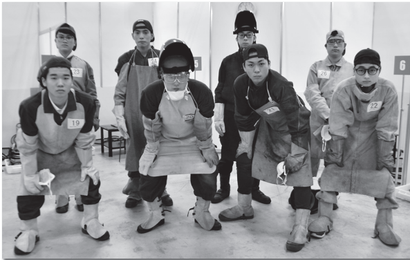
東京都代表2選手が出場した第3組