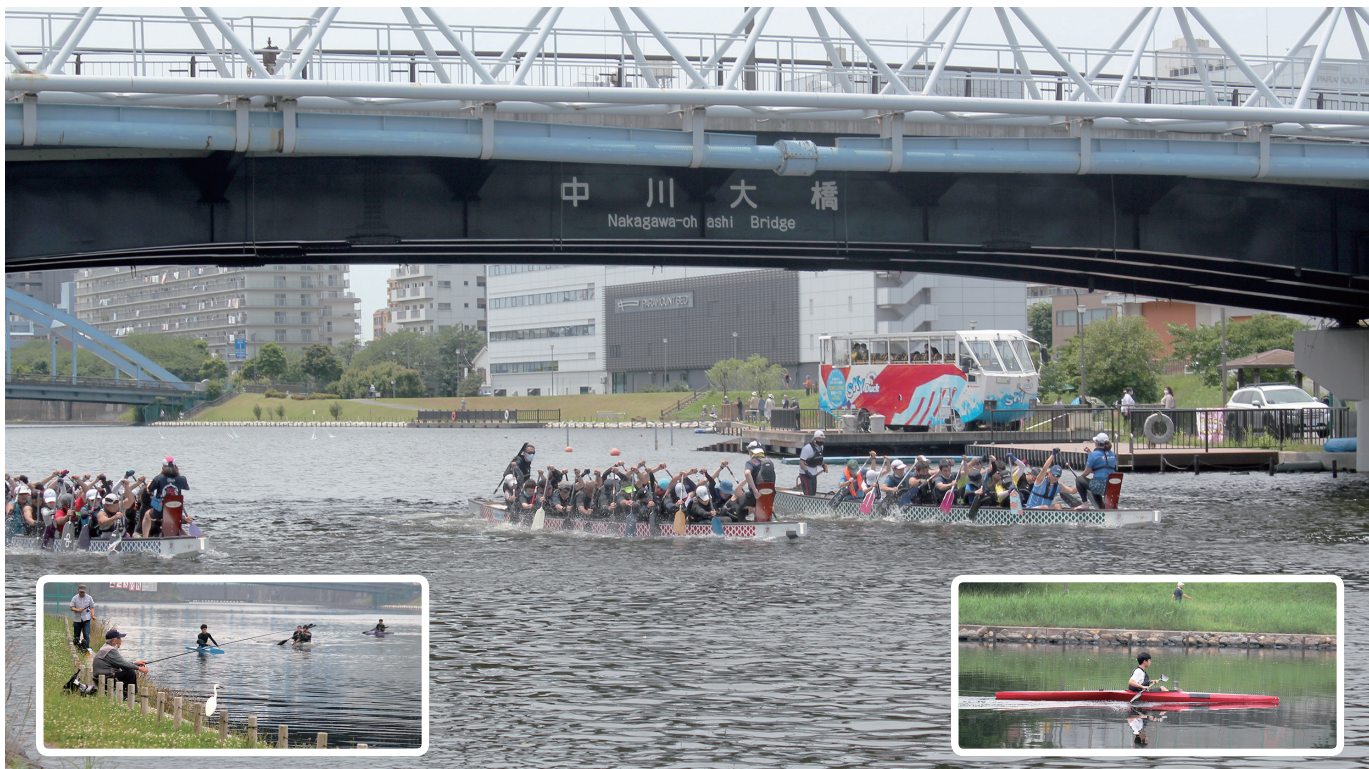
中川大橋 (東京都江東区・江戸川区)

一般社団法人 東京都溶接協会 公益社団法人 ボイラ・クレーン安全協会 株式会社 三浦事務所 発行所・東京都江東区大島三丁目1番11号 産学協同センター 電話 03-3685-5700 (代表) 編集発行人 三浦 繁夫 © 2022 毎月1回1日発行 定価 100円・〒共