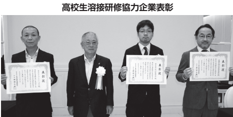
高校生溶接研修協力企業表彰