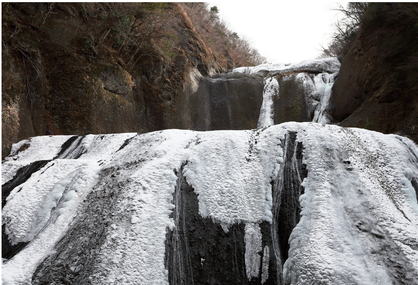
袋田の滝 (茨城県久慈郡大子町)

一般社団法人 東京都溶接協会 公益社団法人 ボイラ・クレーン安全協会 株式会社 三浦事務所 発行所・東京都江東区大島三丁目1番11号 産学協同センター 電話 03-3685-5700 (代表) 編集発行人 三浦 繁夫 © 2021 毎月1回1日発行 定価 100 円・〒共