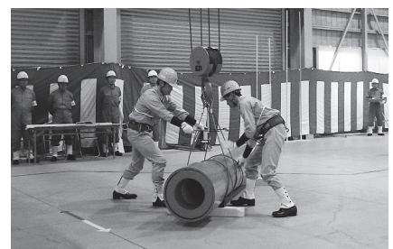
(写真は第48回全国大会風景)

《お問い合わせ》公益社団法人 ボイラ・クレーン安全協会 教育部 〒136-0071 江東区亀戸6-41-20 機缶健保会館 TEL：03-3684-5551