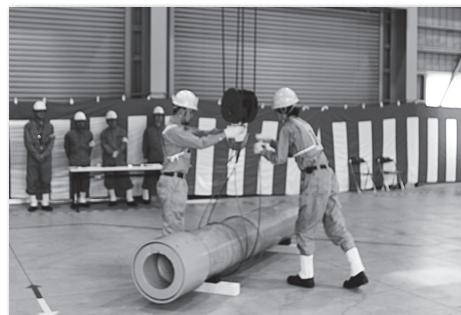
(写真は技能競技全国大会風景)

平成29年度 JIS Z 3410 (ISO 14731)/WES 8103 による