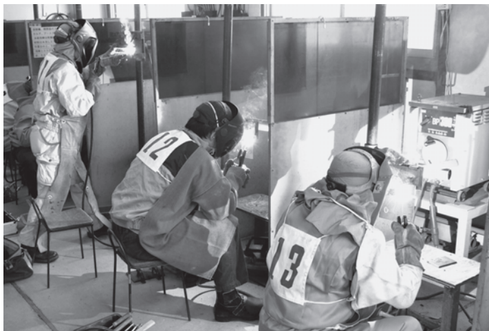
火花を散らし健闘する選手たち(昨年の競技風景より)

実)をやるが、その数は朝は三つ、暮れは四つとされた」といったところ、猿達は、牙を剥き出して怒りだした。では、朝は四つ夜は三つにしようという、今度は凡ての猿が大喜びをしたという。 三と四、四と三どちらにしても合計は七つ、名実共に変わらないのですが、愚かなものは、その時の気分が左右されて、あるいは喜びあるいは怒る。 そこで莊子は、世の是非の議論をする人々を戒めて君たちが精神を勞し、口角沫を飛ばして議論しても、同じ結論に到達する。まるで猿どもが朝三暮四、朝四暮三に一喜一憂するのと同じではないか、と叱っている。 諸橋 徹次著 「十二支物語」より