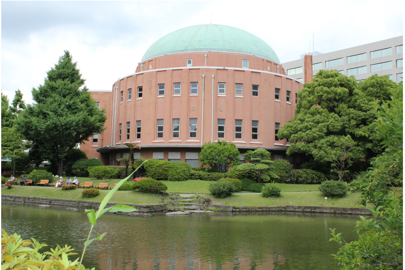
両国公会堂 (墨田区横綱1)

一般社団法人 東京都溶接協会 公益社団法人 ボイラ・クレーン安全協会 株式会社 三浦事務所 発行所・東京都江東区大島三丁目1番11号 産学協同センター 電話 03-3685-5700 (代表) 編集発行人 三浦 繁夫 © 2015 毎月1回1日発行 定価 100円・〒共