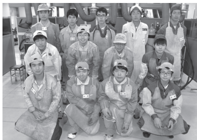
参加者全員での記念写真

東京都溶接協会は8月29日、東京・足立区の都立城東職業能力開発センターで高校生溶接合同練習会を開催した。練習会に先立ち7月には工業高校教員を対象に昨年に続き溶接研修会を企画開催した。その後各校で教員の指導を受けた生徒達は、12月19日に計画する第2回東京都高校生溶接コンクールに向け技能向上に励んでいる。 この合同練習会は、都内の5校（日本工大駒場、荒川工業、杉並工業、蔵前工業、墨田工業）13名の生徒が参加した。講師陣から12月のコンクール課題について講義を受けた後、実習に移り夕刻まで技能向上に励んだ。