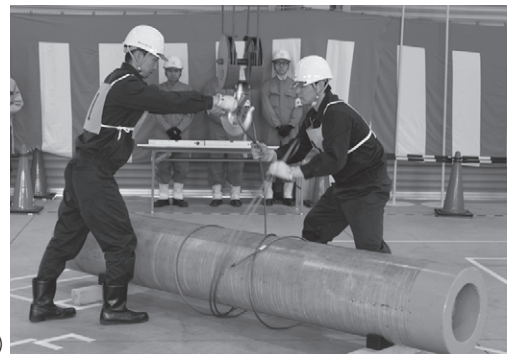
(写真は技能競技全国大会風景)

平成27年度 JIS Z 3410 (ISO 14731)/WES 8103 による