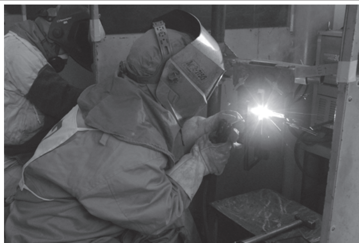
火花を散らし健闘する選手たち(昨年の競技風景より)