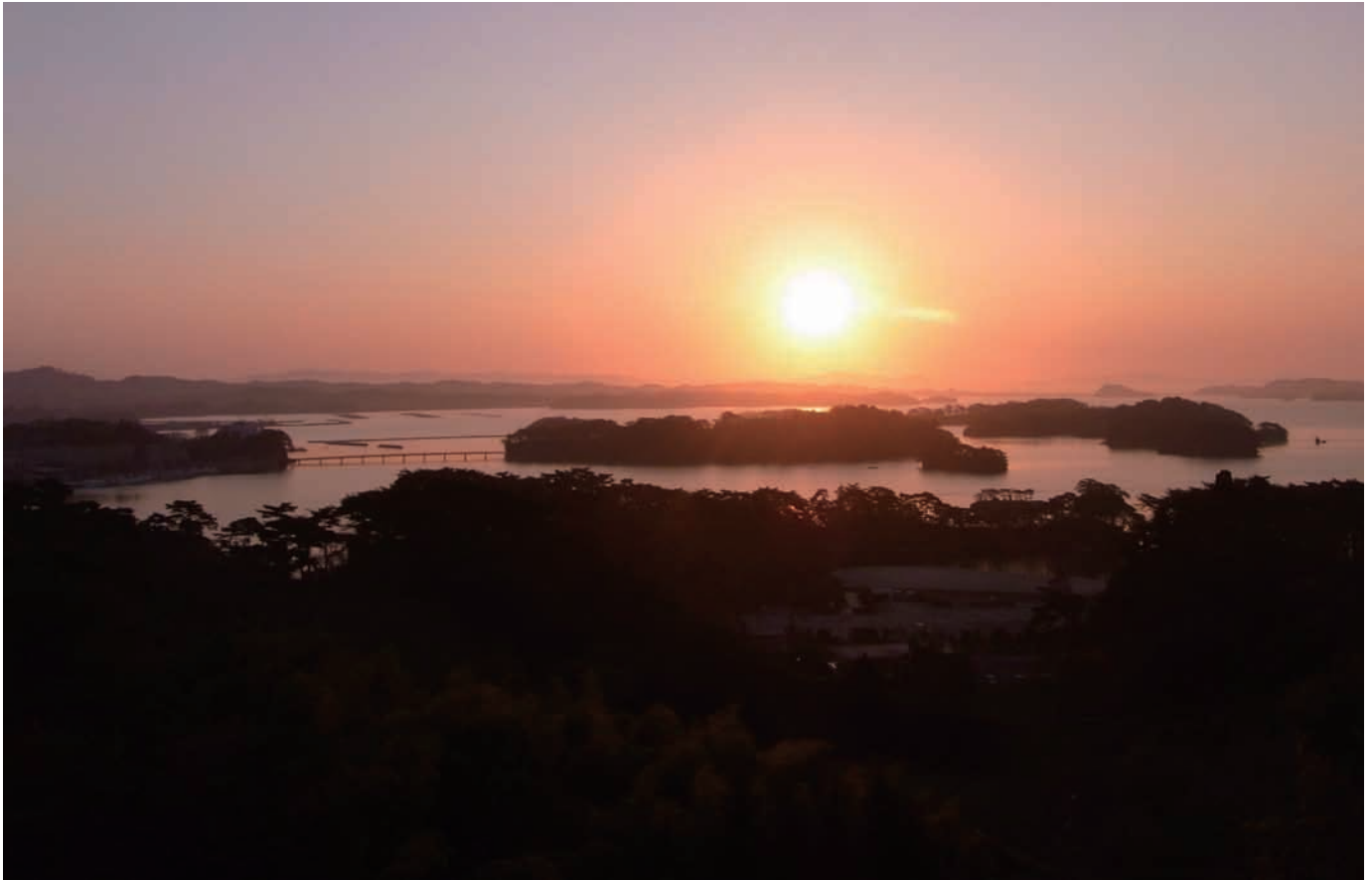
日の出：松島湾（宮城県）

一般社団法人 東京都溶接協会 公益社団法人 ボイラ・クレーン安全協会 株式会社 三浦事務所 発行所・東京都江東区大島三丁目1番11号 産学協同センター 電話 03-3685-5700(代表) 編集発行人 三浦 繁夫 © 2015 毎月1回1日発行 定価 100円・〒共