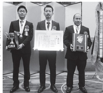
クレーン運転及び玉掛け 技能競技全国大会 優勝チーム 東開工業株式会社様