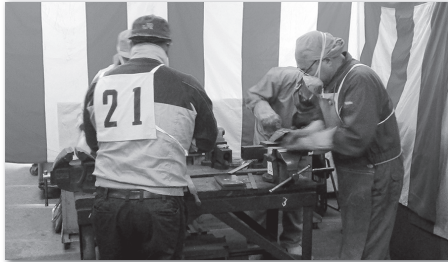
厚生労働省 増岡副主任中央産業安全専門官