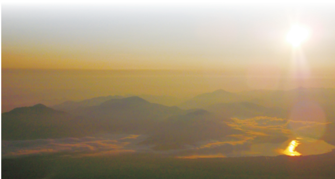
富士山から俯瞰した山中湖に差し込む朝日