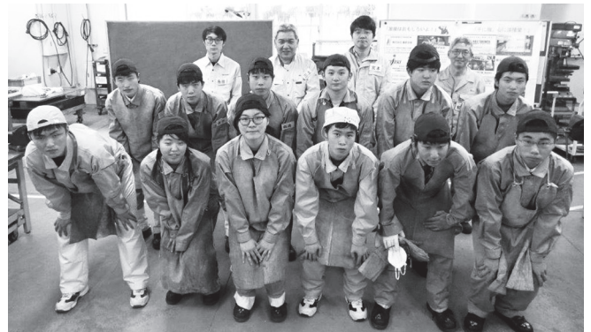
担当講師と参加した生徒

また、8月28日には江東区の産学協同センターで毎年恒例となった東京都高校生溶接コンクール(若手人材育成溶接コンクール)の参加希望者への研修会を開催し12月21日の本番に向けた練習を行った。各会場とも実習中は講師陣が各ブースを丹念に回り、受講者全員に丁寧な指導をした。