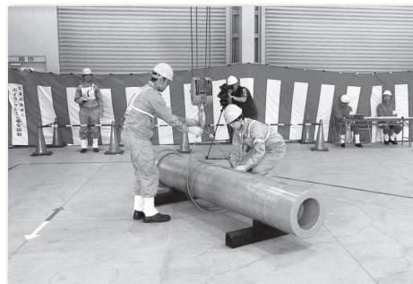
(写真は技能競技全国大会風景)